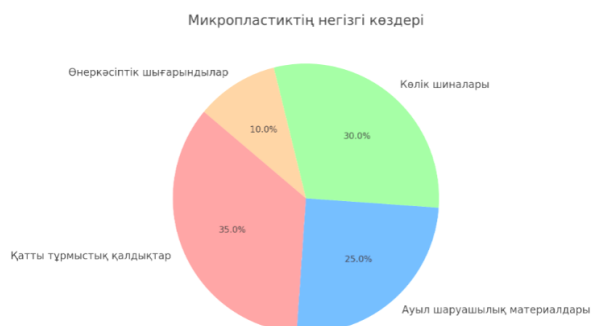
Диаграмма 2. Микропластиктің негізгі көздері

Микрофлораға әсері: Топырақ микрофлорасы топырақ құнарлылығын сақтауда, органикалық заттардың ыдырауында және қоректік заттардың айналымында маңызды рөл атқарады. Ғылыми жарияланымдарды талдау микропластиктердің топырақ микрофлорасының құрамы мен функционалдық белсенділігіне кешенді әсер ететінін көрсетті. Кейбір жағдайларда органикалық заттардың ыдырауына және азотты бекітуге қатысатын пайдалы бактериялар мен саңырауқұлақтардың саны мен әртүрлілігі азаяды, ал басқаларында өсімдік ауруларының дамуына және топырақ сапасының нашарлауына әкелетін патогенді микроорганизмдер санының артуы байқалады. Сонымен қатар, микропластиктер топырақ микроорганизмдеріне қосымша токсикалық әсер ететін әртүрлі ластаушы заттардың (ауыр металдар, пестицидтер) адсорбциясы үшін субстрат ретінде қызмет ете алады.